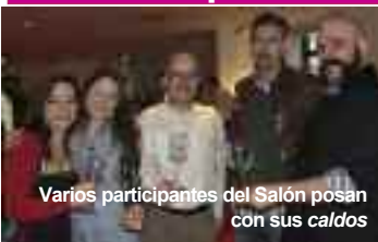
Varios participantes del Salón posan con sus caldos

El primer piso del Hotel Domine reunió el pasado lunes 30 de enero a profesionales y amantes del mundo del aceite y del vino. ¿La excusa? Pues ninguna otra que la celebración del Salón Enolia, que en esta edición cambió de escenario (el año pasado fue en Alhóndiga) y se decidió por el céntrico hotel. En