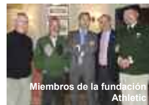
Miembros de la fundación Athletic