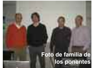
Foto de familia de los ponentes