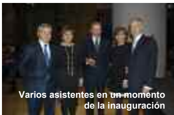
Varios asistentes en un momento de la inauguración

El Museo Guggenheim de Bilbao arrancó con su primera exposición del año con 93 obras de arte contemporáneo de los fondos de las colecciones de La Caixa y el MACBA: 'El espejo invertido'. En la presentación, patrocinada por